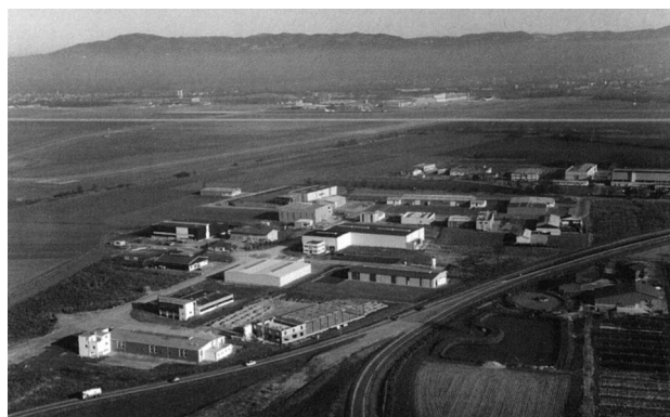
La zone industrielle de Hésingue

En 1973 la société Cryostar s'implante sur le ban de Hésingue. Ainsi germe l'idée de la création d'une zone industrielle. Cette dernière voit le jour le 23 juin 1989 avec l'approbation du conseil municipal.