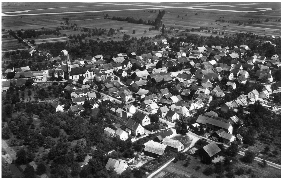
Hésingue au début des années 1960. En-haut de l'image, les pistes de l'aéroport

Après le deuxième conflit mondial, Hésingue adhéra selon décision du conseil municipal du 12 juillet 1946, à la création de la "Région Française de Bâle". L'adhésion à ce groupement d'urbanisme de Bâle-Huningue s'explique par l'intérêt direct de la commune aux travaux de l'aéroport de Bâle-Mulhouse auquel elle doit céder 165 hectares pour la construction des pistes.